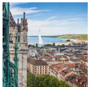
Genève – la plus petite métropole du monde Genf – die kleinste Metropole der Welt

l'ombre des majestueux saules pleureurs, on jouit d'une magnifique vue sur le jet d'eau qui se hisse, depuis le port, dans le ciel genevois à 140 mètres de haut. Outre les joies de la baignade dans le lac ou dans la piscine toute proche, les promenades le long des quais et à travers les nombreux parcs, une balade dans les ruelles animées de la vieille-ville ou dans les élégantes rues de la ville basse, il est possible d'embarquer à bord d'un bateau à roue à aube d'époque pour une excursion sur le plus grand lac intérieur d'Europe centrale à destination d' Yvoire, Evian ou Lausanne .